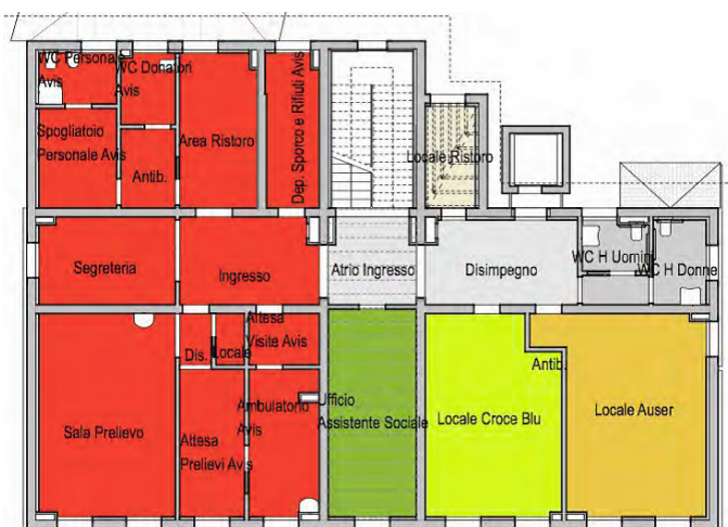
2. Pianta del primo piano