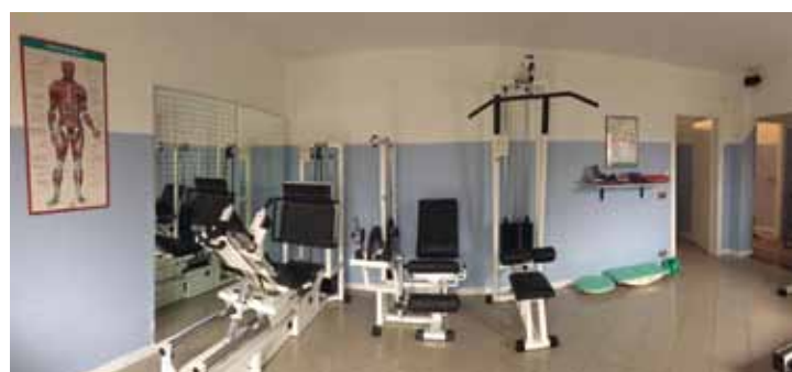
INSERZIONE A PAGAMENTO