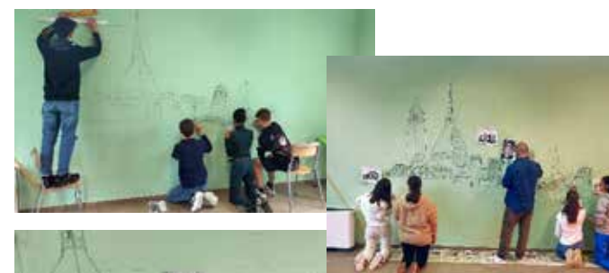
Nelle foto alcune fasi della realizzazione e il murale

I Professori della scuola secondaria di I grado dell'istituto comprensivo S. Neri