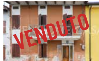
Rif 2629 - SAN POSSIDONIO TERRATETTO MQ 150 EURO 80.000