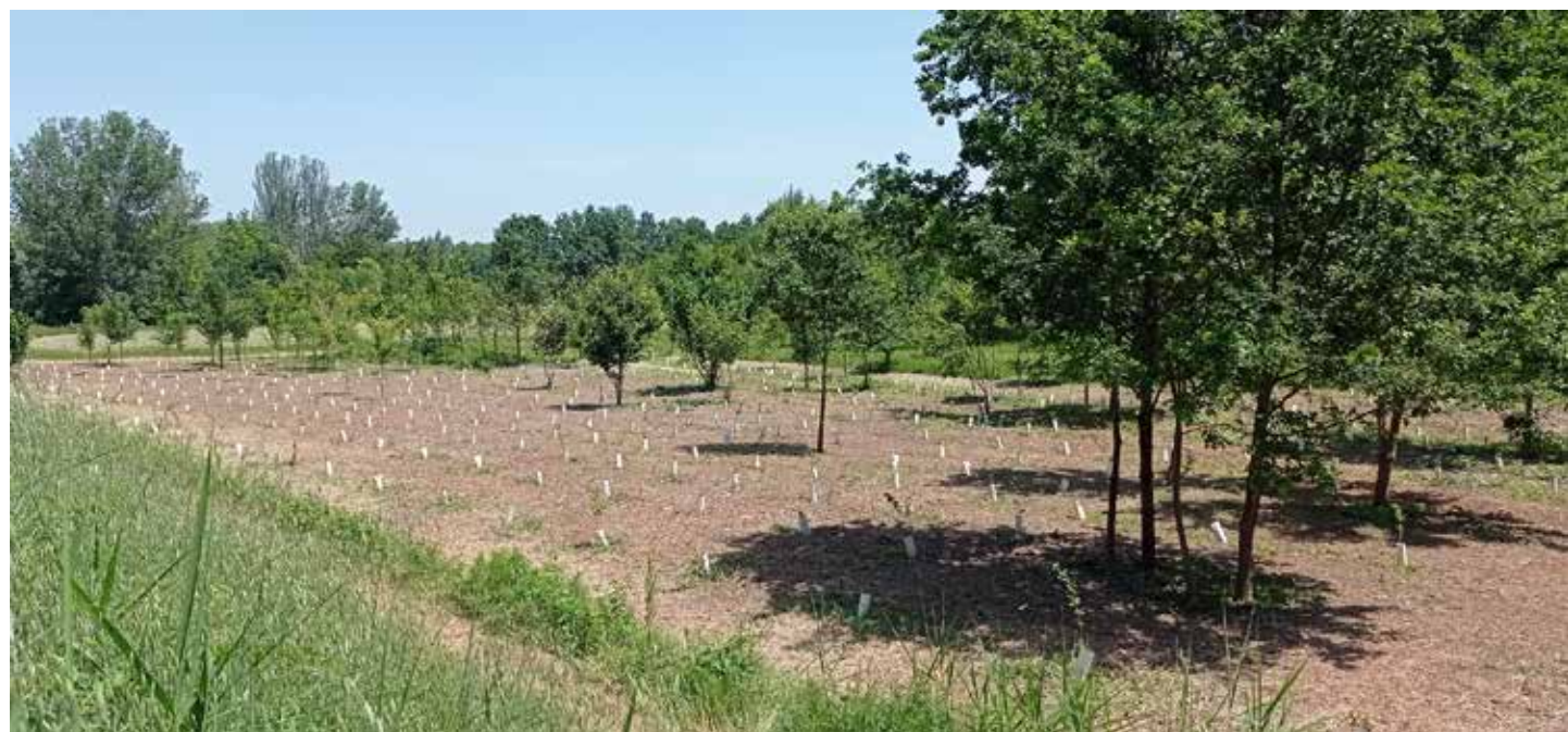
Impianto di forestazione nell'Area Verde del Piano di Recupero "Fornace di Budrighello" riguardante la realizzazione dell'HOSPICE