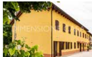
Rif 2885 - SAN POSSIDONIO VILLA DI TESTA MQ 175 EURO 240.000