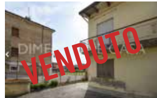
Rif 2622 - SAN POSSIDONIO CASA SEMIINDIP. MQ 110 EURO 105.000